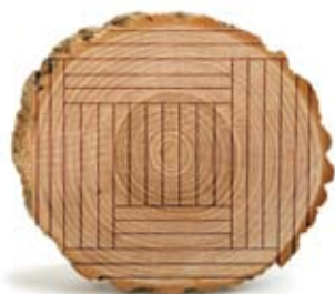
« Plain sawn »

La technique « plain sawn » est la plus répandue. Elle consiste à scier le billot en tranches parallèles à l'axe du tronc sur toute sa longueur. Toutes les planches sont ensuite sciées selon le même plan longitudinal.