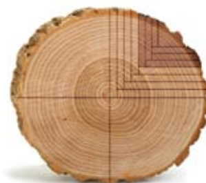
« Rift sawn »

* Ces motifs sont produits par les rayons du chêne.