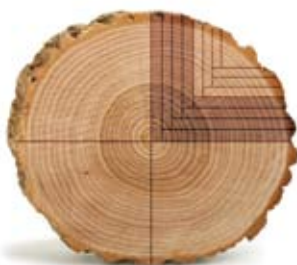
« Quarter sawn »

Chaque planche de bois sciée selon cette méthode présente une apparence unique. En conséquence, les planchers fabriqués avec du bois coupé « plain sawn » auront plus de variations de couleurs et de motifs que les planchers fabriqués à partir de bois coupé selon les autres techniques.